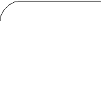
Exhibit No. ( Artículo No. ) (Issued by court:) ( Expedido por el tribunal. ) _____